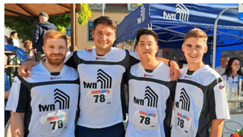
Das Team der TWN beim Firmenlauf 2024

Die Naumburger Nächte laden zu Weltmusik im Domgarten ein.