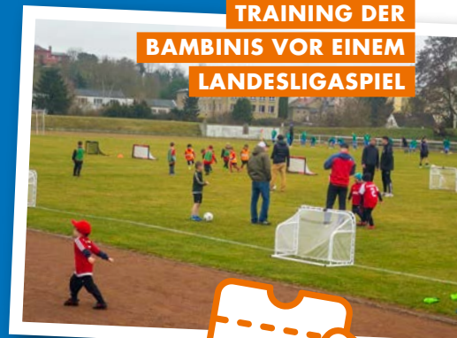
TRAINING DER BAMBINIS VOR EINEM LANDESLIGASPIEL