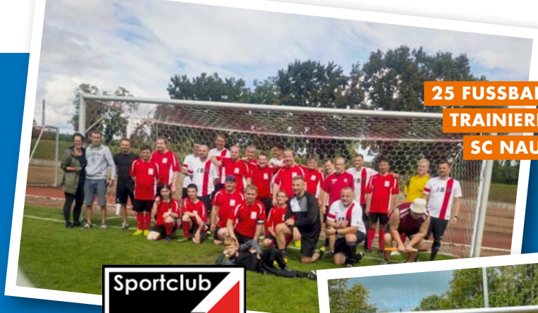
25 FUSSBALLTEAMS TRAINIEREN BEIM SC NAUMBURG

Mit der TWN-Card erhalten Sie 1 Euro Rabatt auf alle Eintrittskarten der 1.-3. Männerfußballmannschaft des SCN.