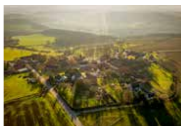
Blick auf Tultewitz