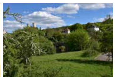
Burg Saaleck und die Rudelsburg links versteckt