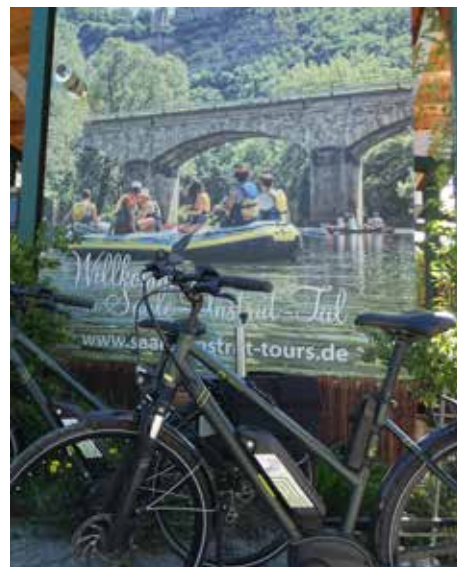
Mit dem TWN-E-Bike die Region entdecken