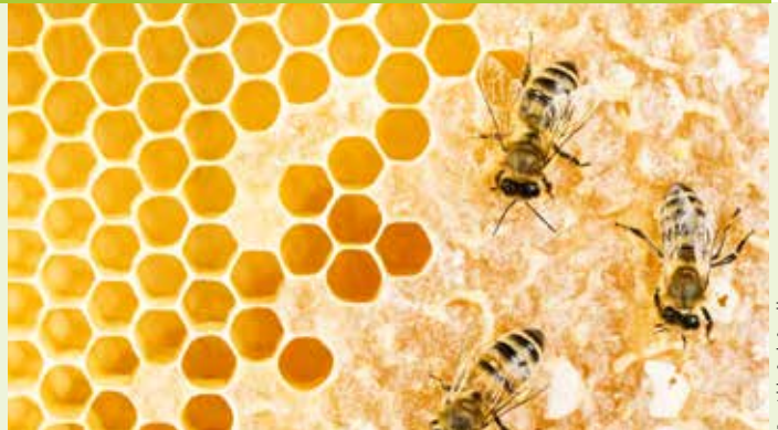
Blick in den Bienenstock