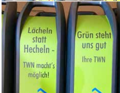
Grün steht auch Ihnen gut!