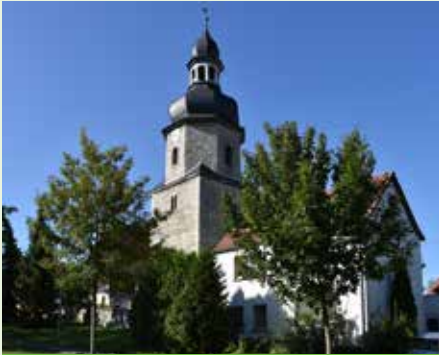
Kirche St. Johanni