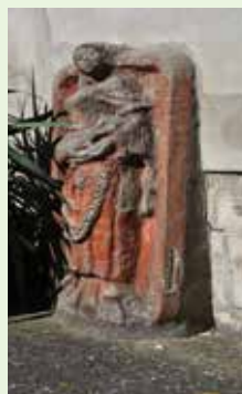
Figur am Brunnen