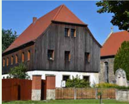
Pilgerherberge mit Pfarrhaus