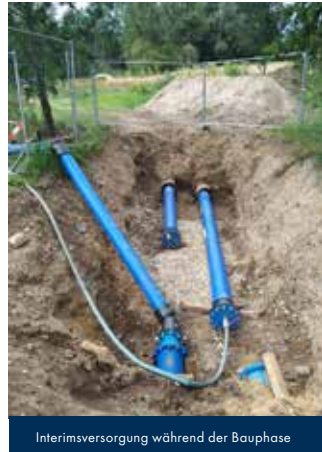
Interimsversorgung während der Bauphase