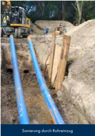
Sanierung durch Rohreinzug