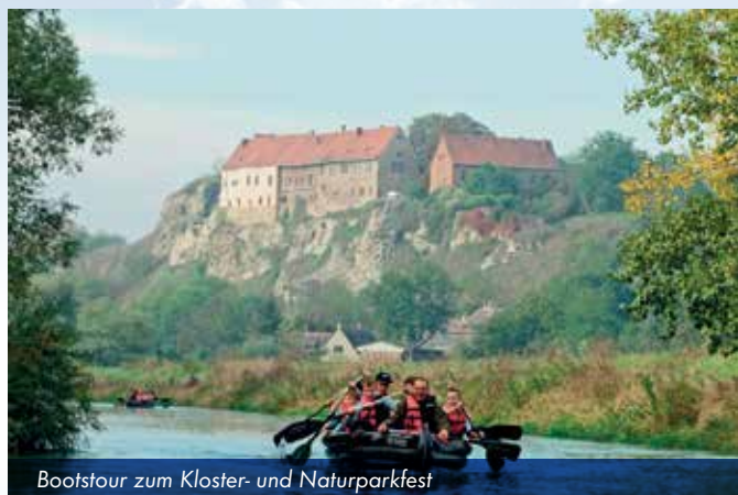
Boottour zum Kloster- und Naturparkfest

Auf Paddeltour im Geo-Naturpark ziehen Weinberge, Steilhänge und Wälder vorbei. Alte Steinbrüche, Mühlen, Schlösser, mittelalterliche Burgen, Aussichtstürme und Weinberghäuschen liegen am Ufer. Bootsvermietungen mit Transferservice sowie zahlreiche Anlege- und Übernachtungsmöglichkeiten machen kleine Abenteuer zu Wasser und Land bequem. Als mäßiges Fließgewässer ist Paddeln auf der Unstrut besonders entspannend und familienfreundlich. Auf allen Strecken werden Saale und Unstrut durch Schleusen reguliert. In der Saison können diese durch Wasserwanderer genutzt oder durch Umtragestellen umgangen werden. Tages- und Mehrtagestouren sind möglich: Zum Beispiel auf 20 km entlang von Kirchscheidungen über die Weinstadt Freyburg bis zur Mündung in die Saale im Naumberger Blütengrund.