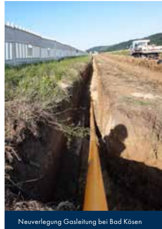
Neuerlegung Gasleitung bei Bad Kösen