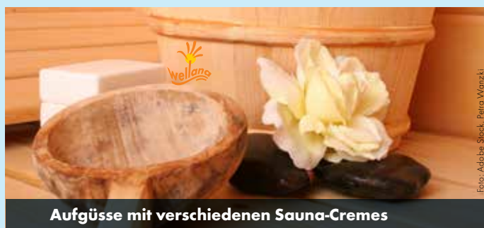
Aufgüsse mit verschiedenen Sauna-Cremes